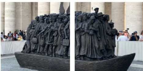
"Angeli Inconsapevoli" opera realizzata da Timothy Schmalz