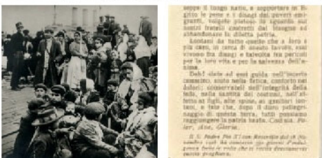
Lettera Papa Pio X

Mantova è stata la città attraverso cui tutto il Lombardo/Veneto ha fatto tappa per emigrare verso le Americhe.