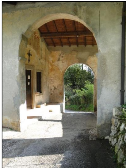
La chiesa della Madonna della Neve