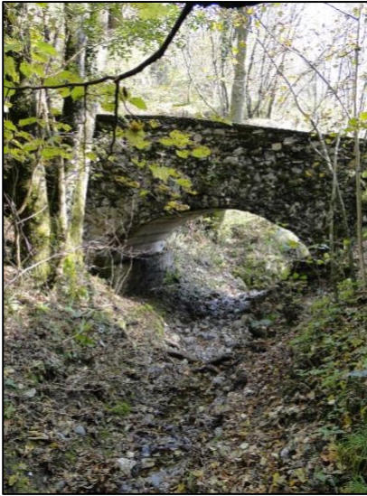
Il ponte sull'Albina

Il percorso si snoda su di una mulattiera, si consiglia l'uso di scarponcini e bastoncini.