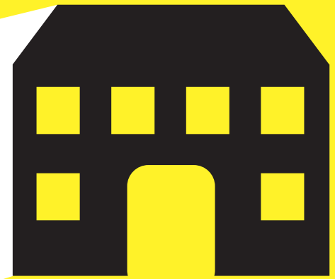
TEATRO ROSCIATE SCANZOROSCIATE