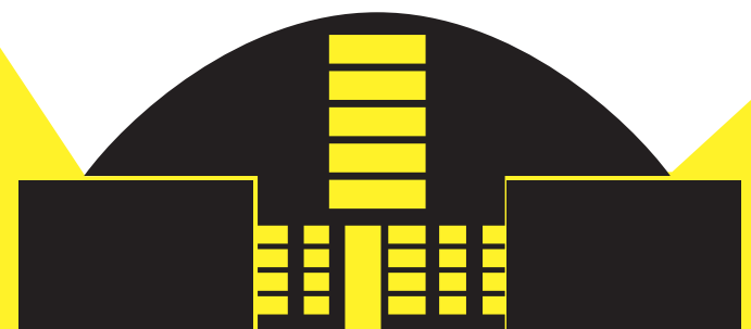
CENTRO POLIVALENTE DI BRUSAPORTO