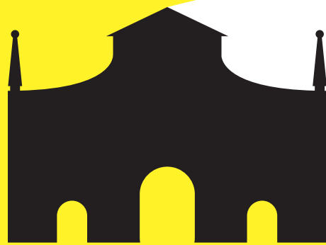
SALA DI PORTA SANT'AGOSTINO