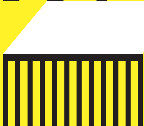
AUDITORIUM DI PIAZZA DELLA LIBERTÀ