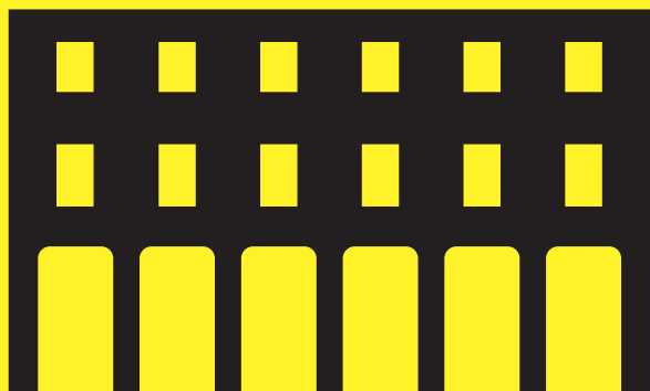
CINETEATRO SAN SISTO DI COLOGNOLA