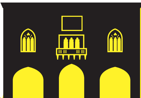
PALAZZO DELLA RAGIONE