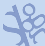
SOC. IT. GERONTOLOGIA E GERIATRIA