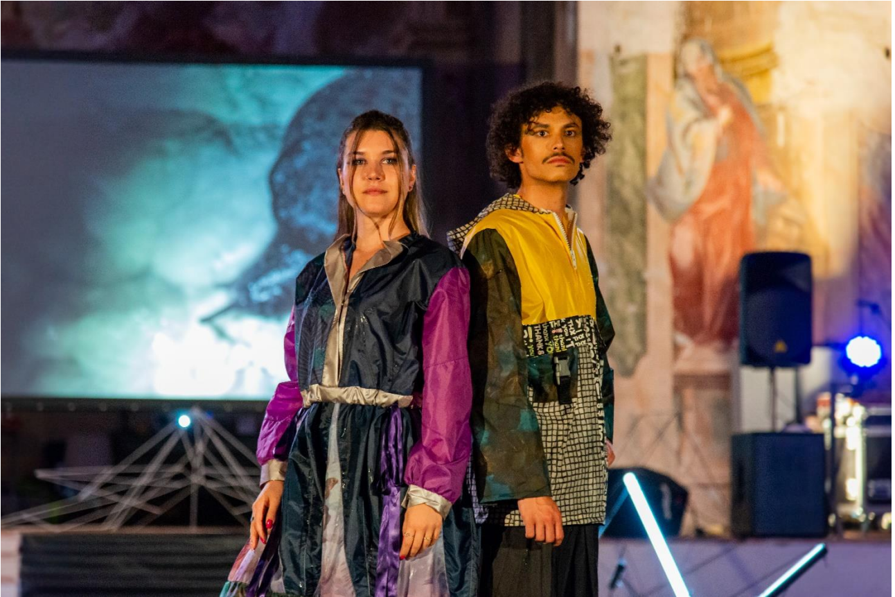
Capi realizzati mediante upcycling (tessuto di ombrelli rotti) – sfilata - giugno 2023

APERTI AL DIALOGO E DISPONIBILI ALL'ASCOLTO